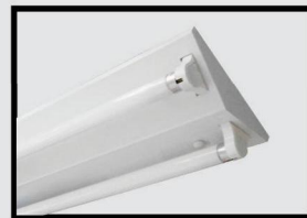
LTK: sơn tĩnh điện